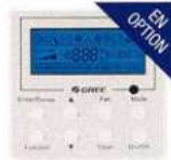
Thermostat filaire (XE-71)