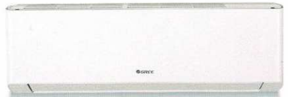
Unité murale Extreme